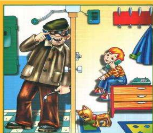
Не разговаривай и не открывай дверь незнакомым людям