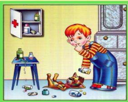
Не трогай таблетки