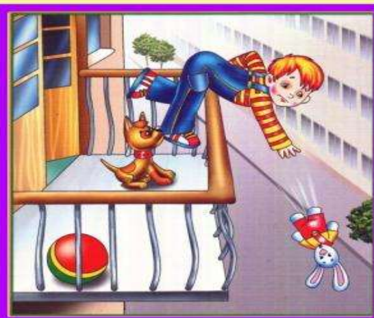
Не играй на балконе, упадешь