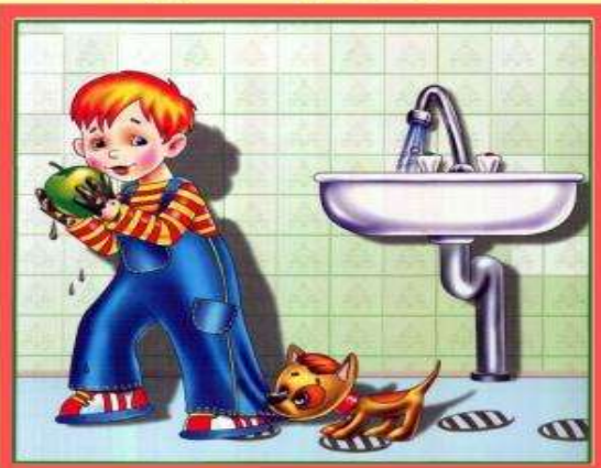
Мойте руки перед едой